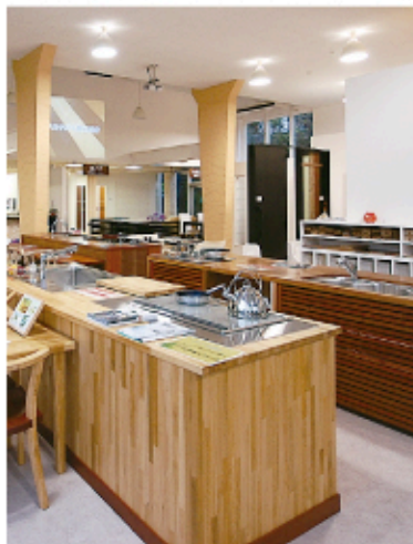
オリジナルの木製キッチン。無垢材や修正材を使って、木の質感を生かしている