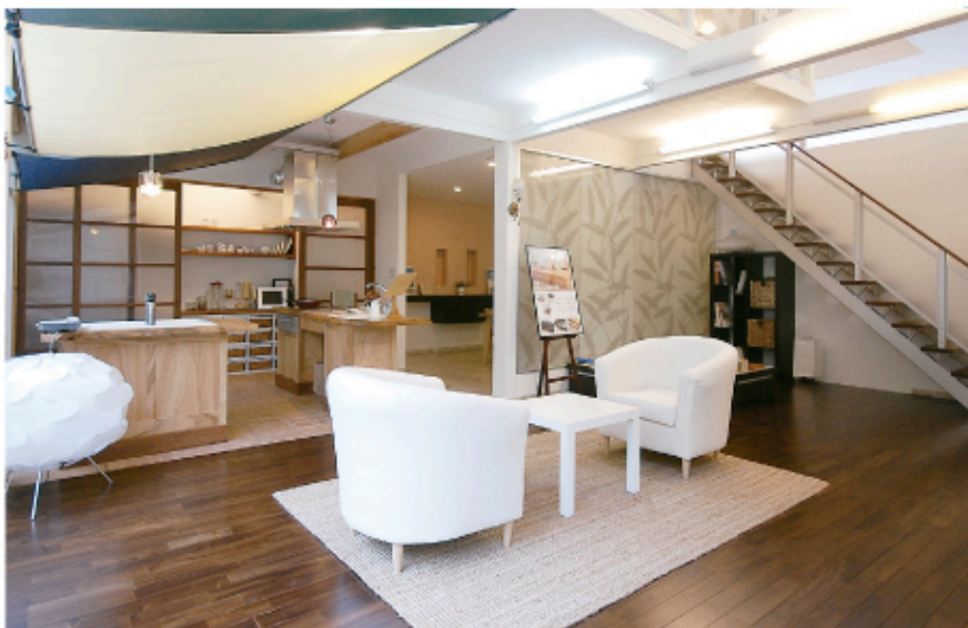
ショールーム内のモデルスペース。展示品の壁材や床材などに合わせて、キッチンや収納といった設備や家具をコーディネート。実際の空間がイメージしやすい