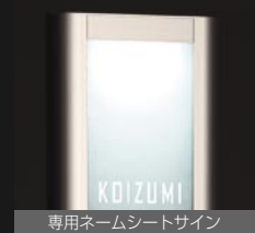
専用ネームシートサイン