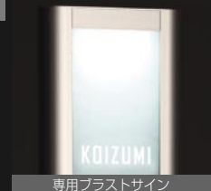
専用プラストサイン