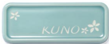
▲ SF 表札 II 書体：DFP 風雲体 品番：GM1-SFS-2-□