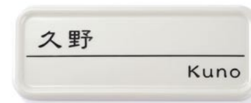
▲ SF 表札 VI 書体：DFP 隷書体 品番：GM1-SFS-6-□