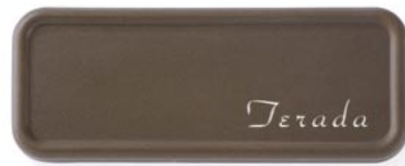
▲ SF 表札 IV 書体：Park AveD Regular 品番：GM1-SFS-4-□