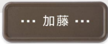
▲ SF 表札 III 書体：DFP 華康ゴシック体 品番：GM1-SFS-3-□