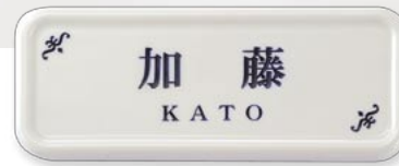
▲ SF 表札 V 書体：DFP 平成明朝体 品番：GM1-SFS-5-□