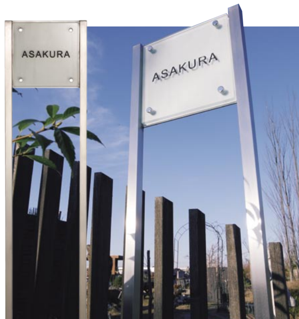
● ベースプレート仕様

※ネームプレートのお名前レイアウト作成は3回目より有料¥1,000 (¥1,050 税込み) となり、受注に至らない場合でも料金が発生しますので予めご了承ください。