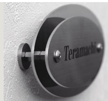
▲ミラーノ 02の側面アップ