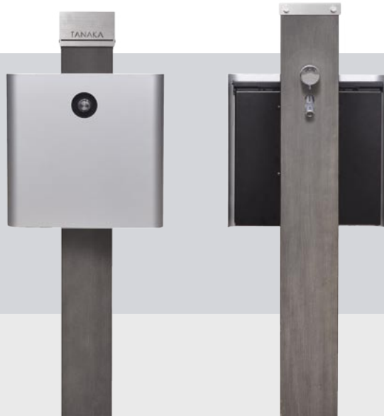
表札・ポスト付前面

△ ポストに同梱されている台座はご使用頂けません。別途ポスト取付けプレートセットを御注文ください。