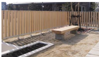
KZ1-802 (配管無し) 使用