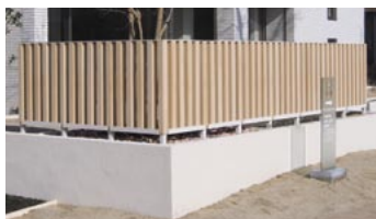
アトリスパーク刈谷

地面に埋める長さを変えることで上下のリズムを生み出すことが出来ます。また、お庭の柵としてもご利用いただけます。